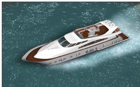
Изображение яхты на «живой 3D метке»

«Яхта» – это наглядный пример того, как ярко и оригинально с помощью «живых 3D меток» можно представить эксклюзивный товар покупателю. В данном случае, дорогую яхту класса «люкс», которая сегодня находится за пределами России. На «живой 3D метке» мы разместили 3D модель яхты, которая рассекает реалистичные волны Средиземного моря. Если метка остается неподвижной некоторое время, то начинается демонстрация интерьера кают-компания. Вы можете подробно рассмотреть судно не только снаружи, но и внутри.