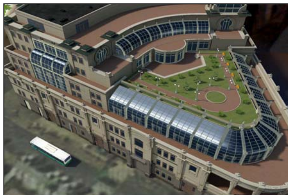
Изображение ТЦ «Негоциант» на «живой 3D метке»

Для своей презентации КРТ использовала яркое и необычное интерактивное 3D решение компании EligoVision – «живые 3D метки» . «Живые 3D метки» - «НегоциантЪ» и «Яхта» были специально разработаны для этого события и показаны в представительстве компании на 3D дисплее JVC со стерео очками.