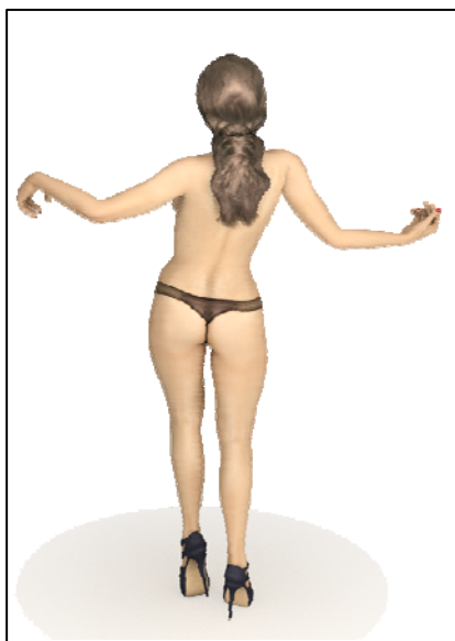
Девушка исполняет танец (вид сзади)

«Живая 3D метка» EligoVision располагается на специальном флаере, который вложен в юбилейный номер. Для того чтобы насладиться грандиозным зрелищем вам необходимо поднести флаер к веб-камере, предварительно скачав небольшую программу на сайте журнала «XXL» http://www.xxl-online.ru/3dmarker или компании EligoVision http://www.eligovision.ru/interesting/demo/5/ . Девушка поприветствует вас, а потом исполнит для вас восхитительный танец под зажигательную музыку!